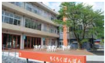
ちくちくぼんぼん

「ちくちくぼんぼん」、「たけくらべ広場」、「竹田水車メロディ〜パーク」の 3施設で10周年感謝祭を同時開催！