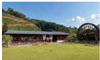
竹田水車メロディ〜パーク たけだや